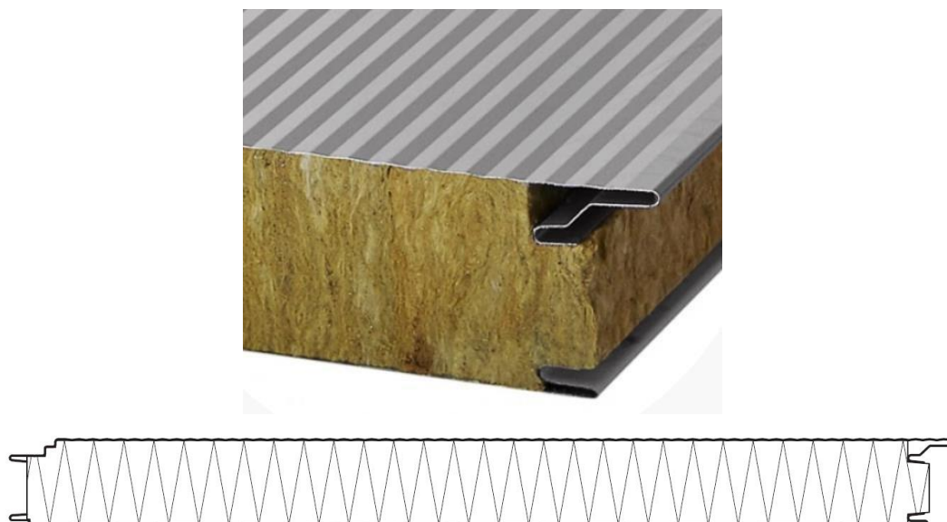
Rys. 1. Przykład płyty warstwowej ściennej MW-W-PLUS rdzeń z wełny mineralnej