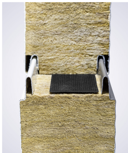
5. PRITLAČENIE TESNENIA ĎALŠÍM PANELOM