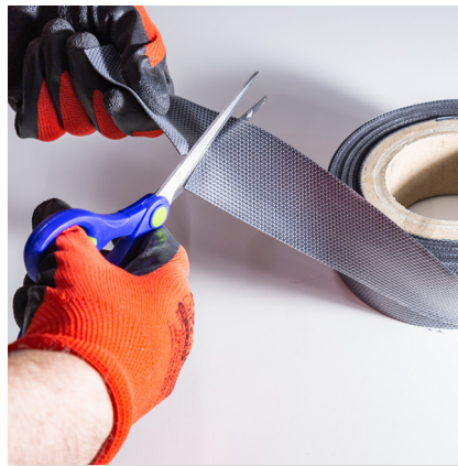
2. REZANIE DĹŽKY TESNENIA PODĽA DĹŽKY PANELU