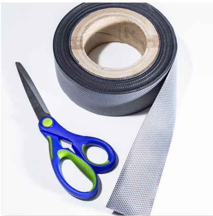
1. PRÍPRAVA TESNENIA A REZNÝCH NÁSTROJOV, NAPR. NOŽNICE