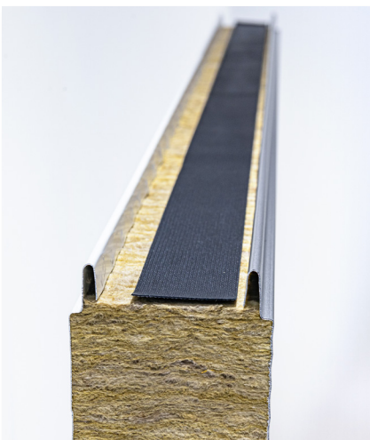
4. ULOŽTE TESNENIE DO ZÁMKU VO VZDIALENOSTI CCA 0,5 CM OD PROFILU VONKAJŠIEHO OBKLADU.